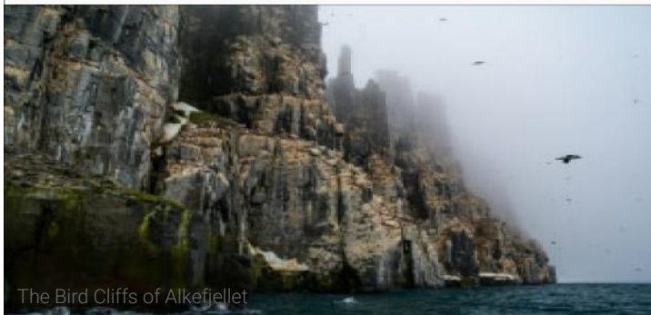
The Bird Cliffs of Alkefiellet