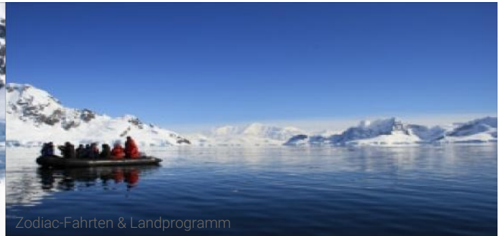
Zodiac-Fahrten & Landprogramm